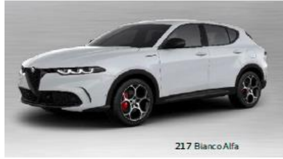
217 Bianco Alfa