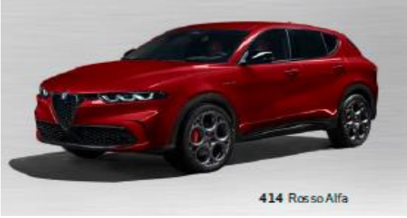
414 Rosso Alfa