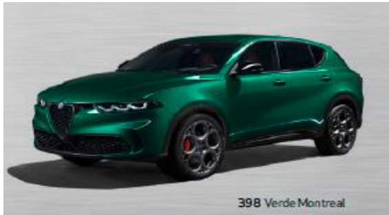
398 Verde Montreal