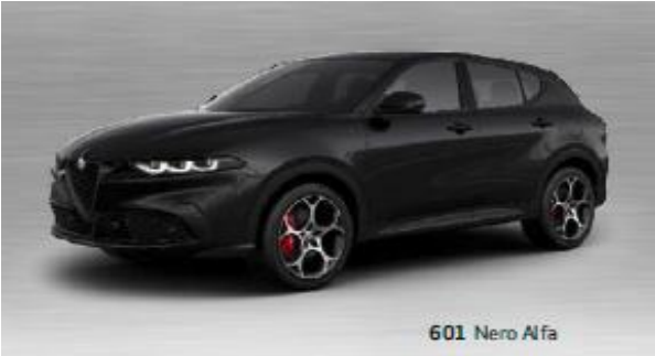
601 Nero Alfa