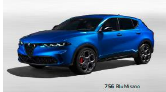
756 Blu Misano