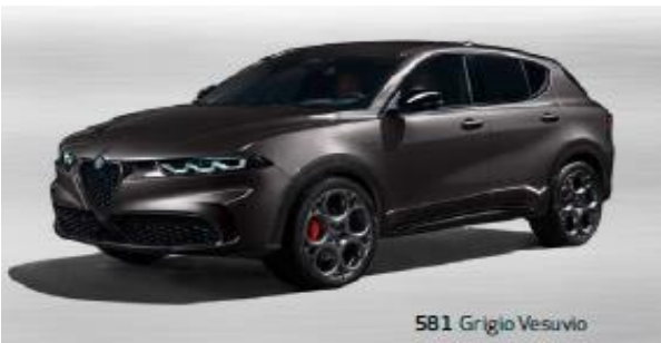
581 Grigio Vesuvio