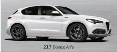
217 Bianco Alfa