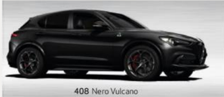
408 Nero Vulcano