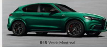
646 Verde Montreal