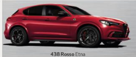
438 Rosso Etna