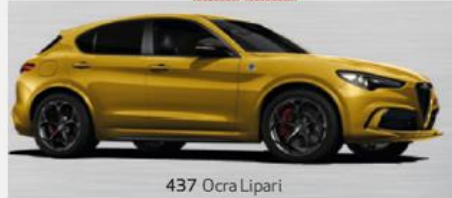
437 Ocra Lipari