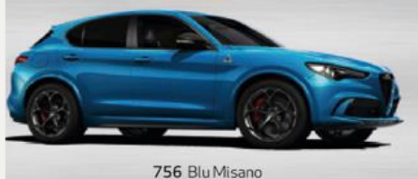
756 Blu Misano