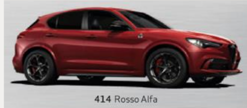
414 Rosso Alfa