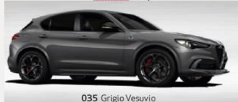
035 Grigio Vesuvio