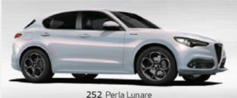
252 Perla Lunare