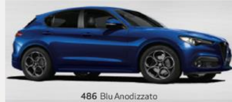
486 Blu Anodizzato