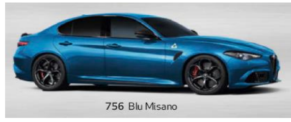
756 Blu Misano