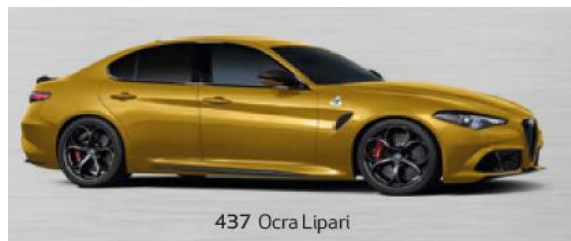
437 Ocra Lipari