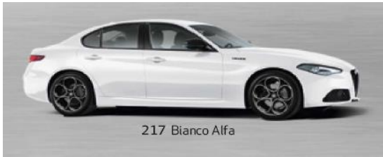
217 Bianco Alfa