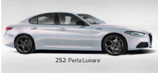
252 Perla Lunare