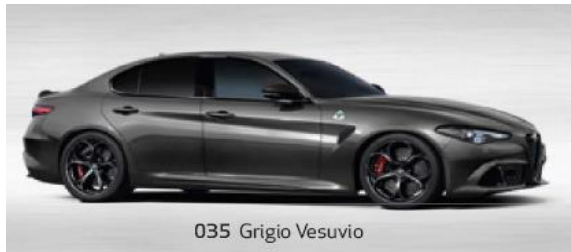
035 Grigio Vesuvio