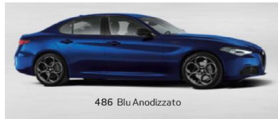
486 Blu Anodizzato