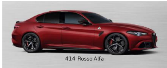
414 Rosso Alfa