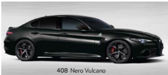
408 Nero Vulcano