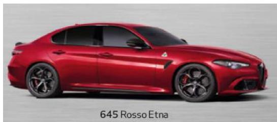
645 Rosso Etna