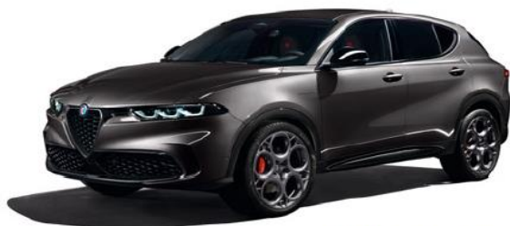
581 Grigio Vesuvio