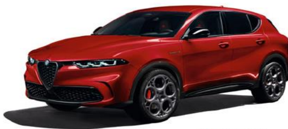
414 Rosso Alfa