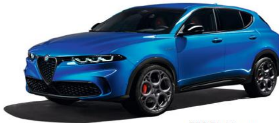
756 Blu Misano