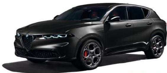
601 Nero Alfa