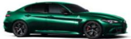
Verde Montreal (398) - Spezial