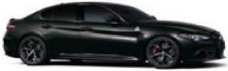
Vulcano Black (408) - Metallic