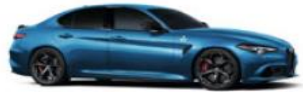
Misano Blue (756) - Metallic