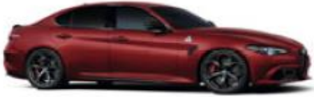
Alfa Red (414) - Pastell