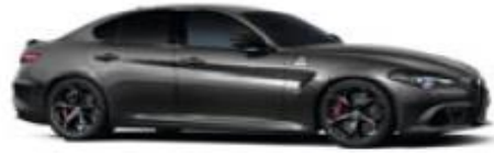
Vesuvio Grey (035) - Metallic