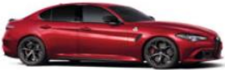
Rosso Etna (645) - Tricolor