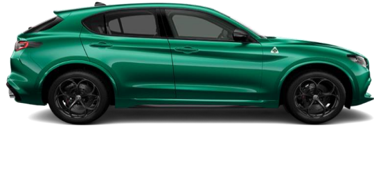
Verde Montreal (398) - Spezial