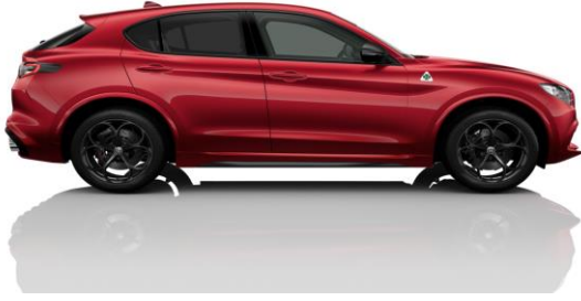
Alfa Red (414) - Pastell