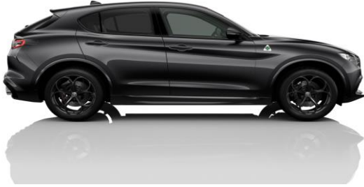
Vulcano Black (408) - Metallic