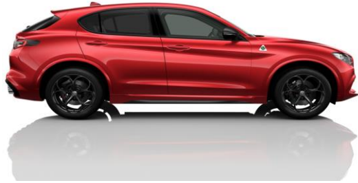
Rosso Etna (645) - Tricolor