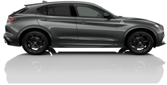
Vesuvio Grey (035) - Metallic