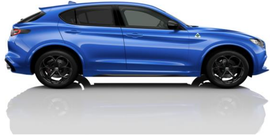
Misano Blue (756) - Metallic