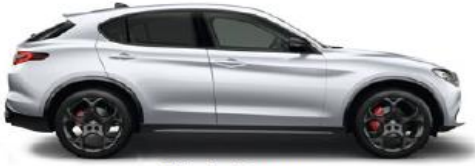
252 Perla Lunare