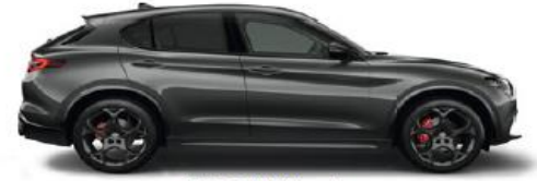
035 Grigio Vesuvio