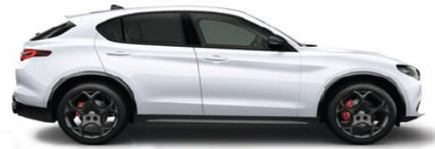
240 Bianco Banchise