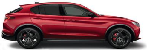
414 Rosso Alfa