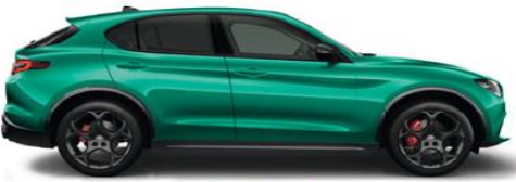
329/398 Verde Montreal