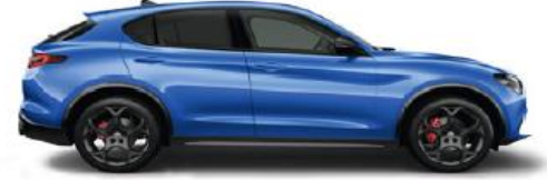
756 Blu Misano