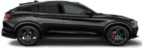
408 Nero Vulcano